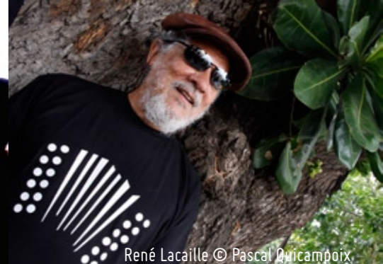
René Lacaille