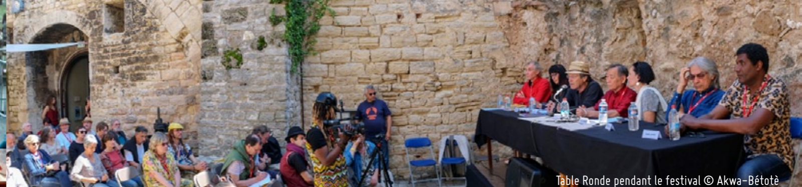
Table Ronde pendant le festival