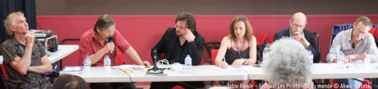
Table Ronde – Festival Les Printemps du monde