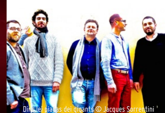
Dins lei piaças dei gigants