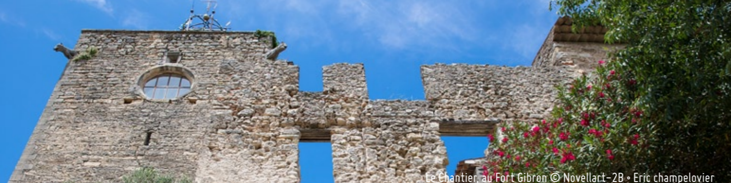
Le Chantier, au Fort Gibron