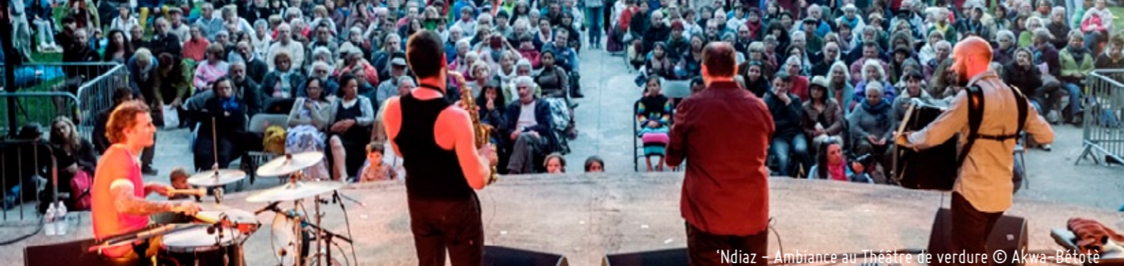
'Ndiaz – Ambiance au Théâtre de verdure