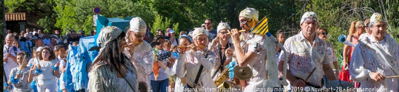
Banda Sagana «Totem Tribute» - Printemps du monde 2019