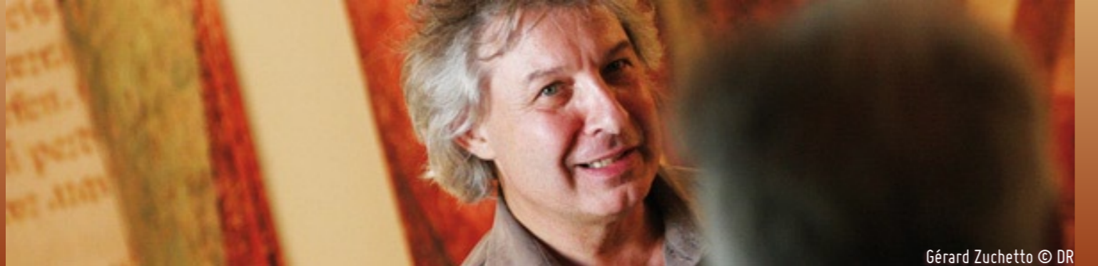
Gérard Zuchetto © DR