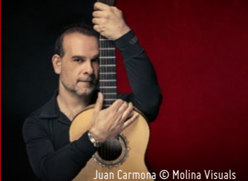
Juan Carmona