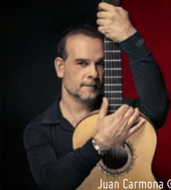
Juan Carmona © Molina Visuals