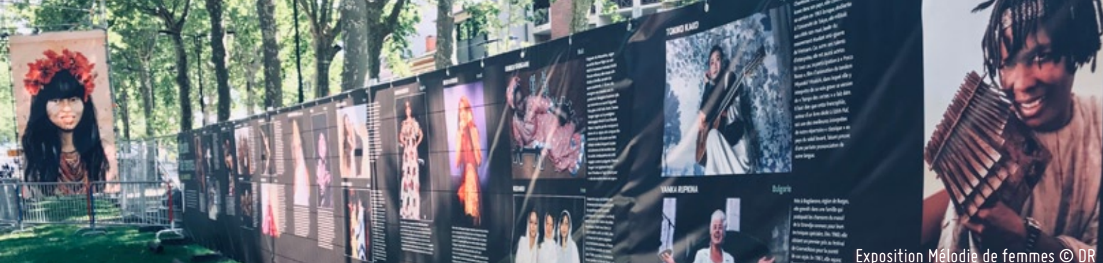
Exposition Mélodie de femmes