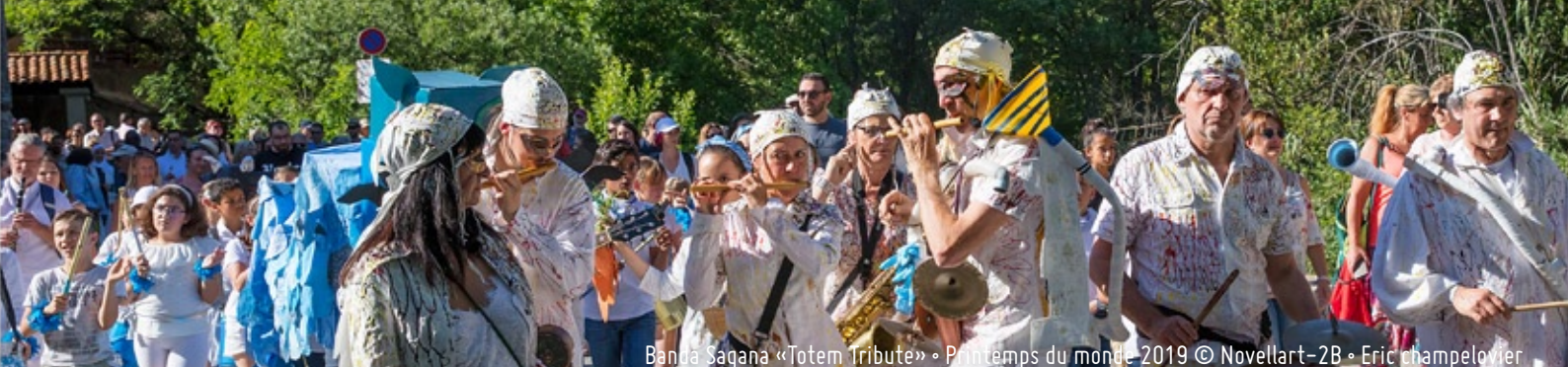
Banña Sagana «Totem Tribute» • Printemps du monde 2019