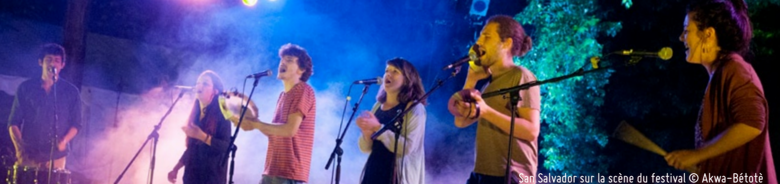
San Salvador sur la scène du festival