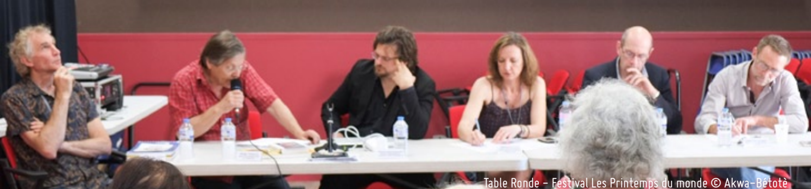
Table Ronde – Festival Les Printemps du monde