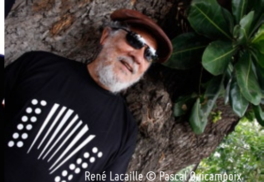
René Lacaille