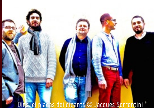
Dins lei piatas dei gigants