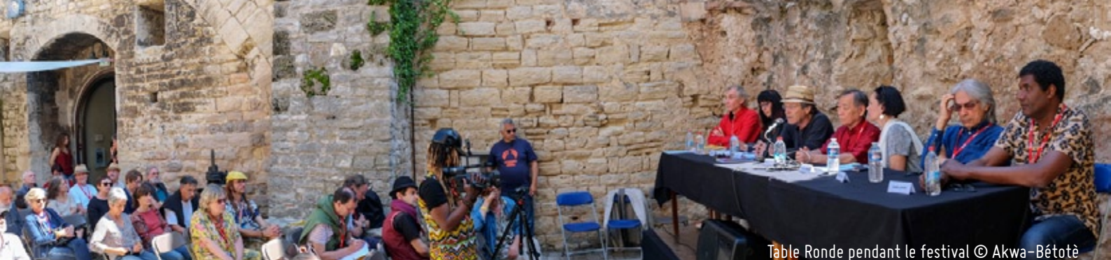
Table Ronde pendant le festival