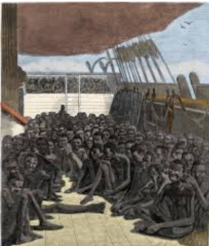
Esclaves africains sur un négrier.